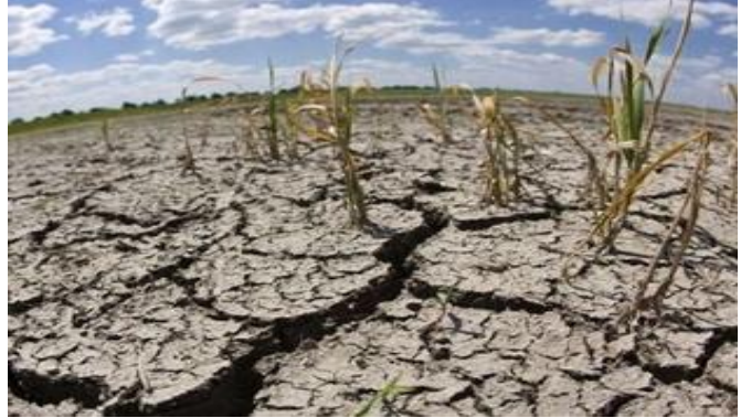
চিত্র: মাটি দূষণের প্রভাব